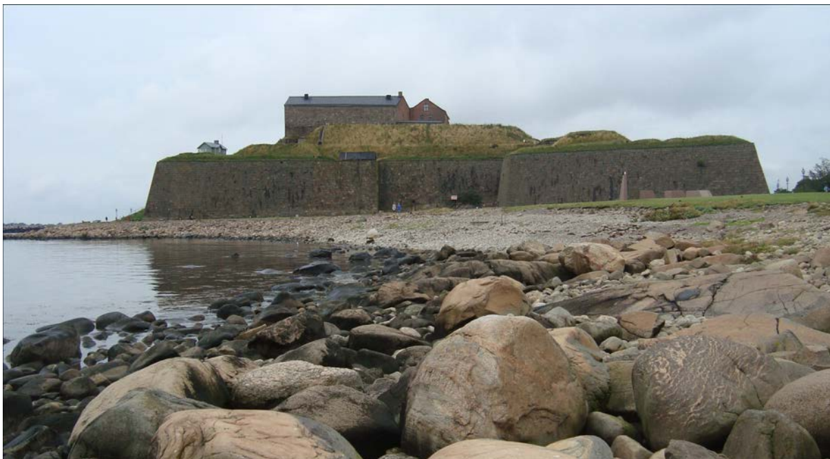
Varbergs fästning